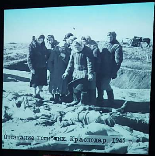
Опознание погибших. Краснодар, 1943 г.

Фото «на память» было найдено в личных вещах убитого немецкого солдата.