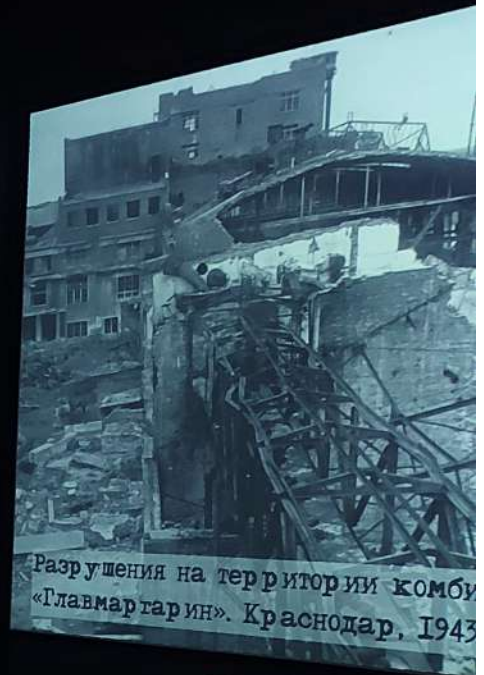
Разрушения на территории комбината «Главмартарин». Краснодар, 1943