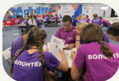
База знаний детского добровольчества