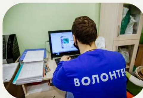
Корпус кибер- волонтеров