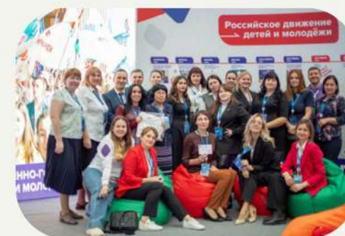
Сообщество педагогов и родителей