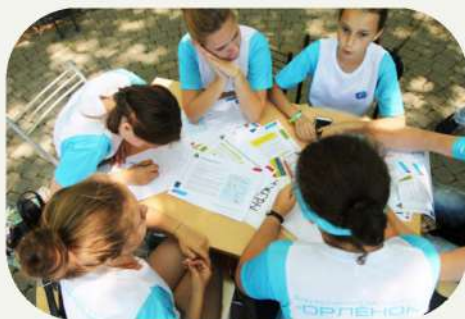
Детский Совет направления