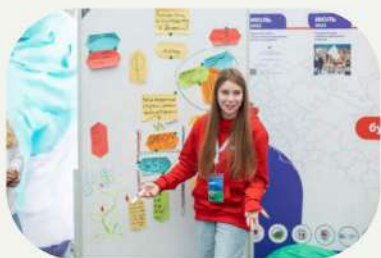
Дорожная карта добровольческих отрядов Первых