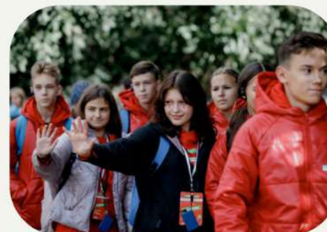
Всероссийский и региональные детские волонтерские корпуса