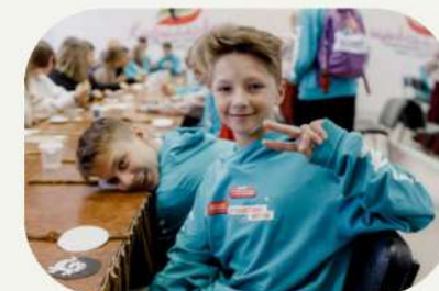
Добровольческий стандарт Движения